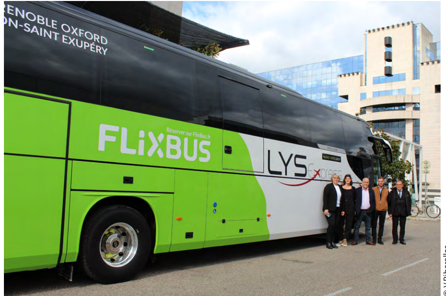
Une partie de l'équipe de Faure Transport devant l'un des nouveaux cars de la ligne LYS Express.

Depuis sa création en 1978, la fameuse LYS Express est devenue un des symboles de la réussite de Faure Transport dont les chauffeurs parcourent chaque année près de 18 millions de kilomètres sur la région. Le groupe vient d'engager 2 millions d'euros afin de changer six des huit cars de tourisme de la LYS Express. « Il était temps de redonner un peu d'air à cette flott », souligne Guillaume Diaz, Pdg de la société familiale, représentant la 6 e génération. La LYS Express, au travers de la filiale d'exploitation Faure Vercors, enregistre cette année près de 288 000 passagers. Autant dire que l'investissement pour une montée en gamme du service revêt une importance de premier plan. « Nous concentrons une part de marché de 30% sur cette destination, tous modes de transports confondus », rappelle Renée Gadoud, responsable du pôle développement commercial, marketing et communication. La performance s'inscrit dans un champ concurrentiel plutôt frontal avec un opérateur de poids face à Faure Vercors : la SNCF, au travers bien sûr de sa ligne ferroviaire mais aussi de son partenaire BlaBlaCar. Retour progressif à la fréquentation record de 2019. Mais Faure Vercors n'avance pas seul. Après l'effondrement